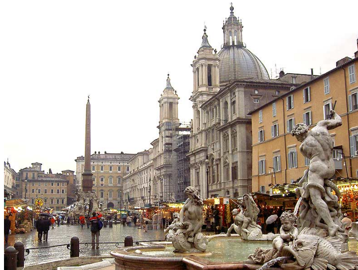
Plaza Navona en Roma (Bernini)

También realizó otras obras relevantes como la Piazza Navona, Iglesia de Sant Andrea en el Quirinal, Scala Regia del Vaticano, Palacio Montecitorio en Roma, sede de la cámara de los diputados, etc.